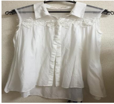
【31 son de mode】