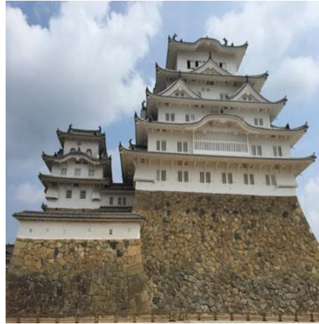
【兵庫県/姫路城/家族】