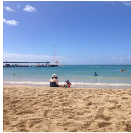
【ハワイ/ホノルルビーチ/家族】