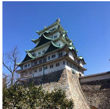
【愛知県/名古屋城/恋人】