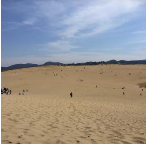
【鳥取県/鳥取砂丘/恋人】