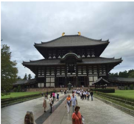
【奈良県/東大寺/一人】