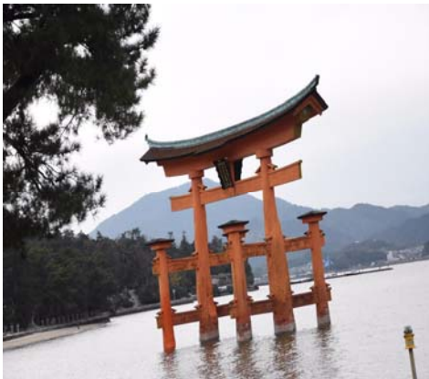
【広島県/厳島神社/友人】