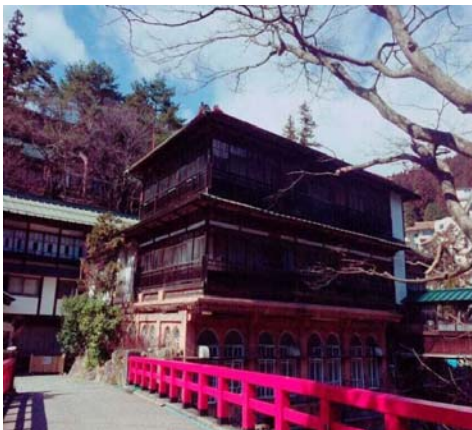
【群馬県/四万温泉/恋人】