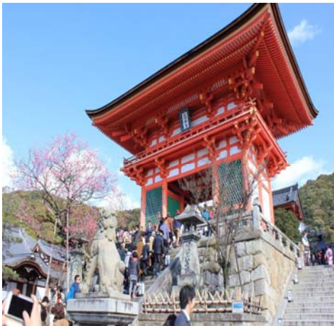
【京都府/清水寺/友人】