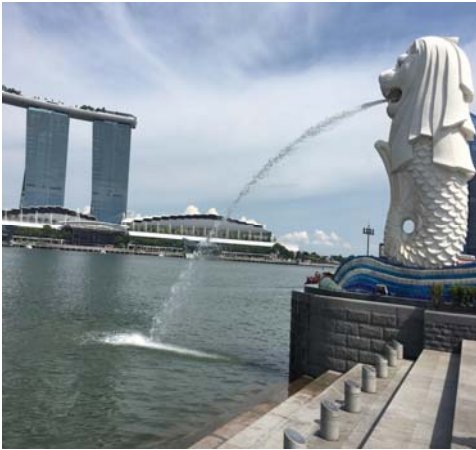
【シンガポール/マーライオン/恋人】