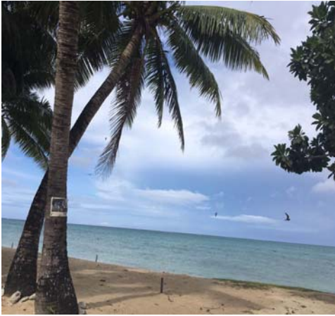
【グアム/タモンビーチ/友人】