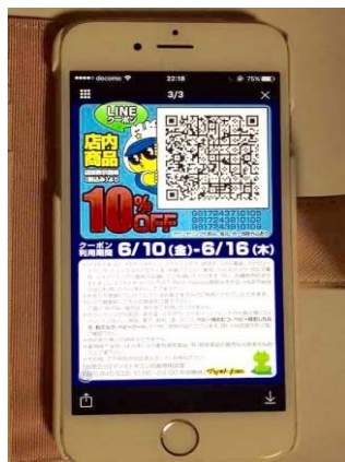
○マツモトキヨシ LINE クーポン