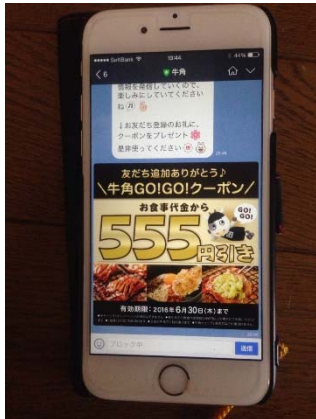
○牛角 LINE 友だちクーポン