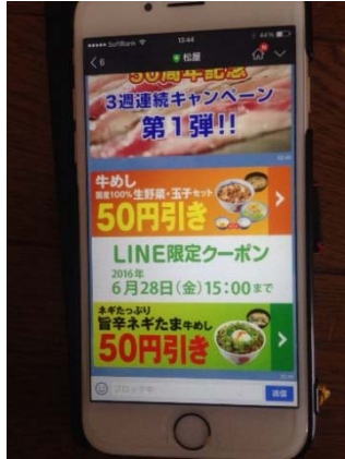
○松屋 LINE 限定クーポン