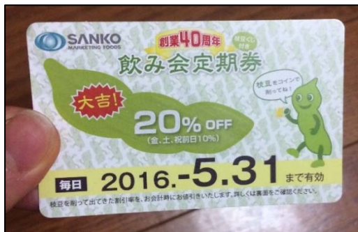
OSANKO 創業記念優待定期券