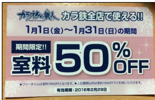
○カラオケの鉄人半額クーポン