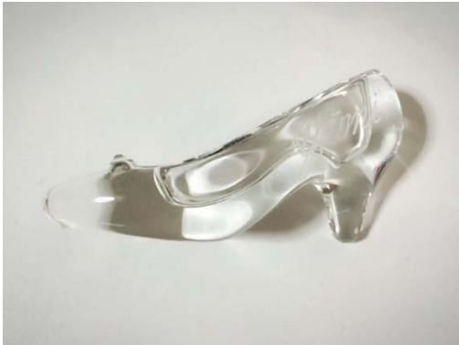
【小さなガラスの靴】