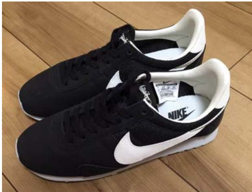
【ブランドロゴでおしゃれ度アップシュ】