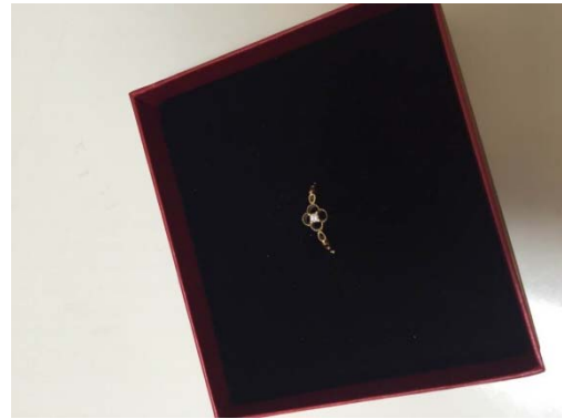
【輝く繊細でラグジュアリーな指輪】